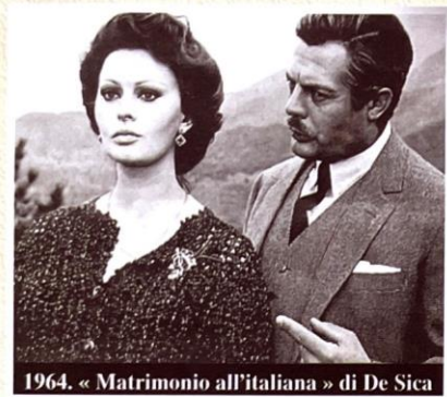
1964. « Matrimonio all'italiana » di De Sica

Marcello Mastroianni: forse il viso italiano più noto nel mondo, ha girato più di 150 film. Ricordiamo: I soliti ignoti (di Mario Monicelli), La dolce vita (1960 di Federico Fellini), Divorzio all'italiana (di Mario Monicelli), Otto e mezzo (di Fellini), e tra i film più recenti Ginger e Fred (di Fellini) e Pret à Porter (1994 di Robert Altman). Il "bel Marcello" è morto nel 1996.