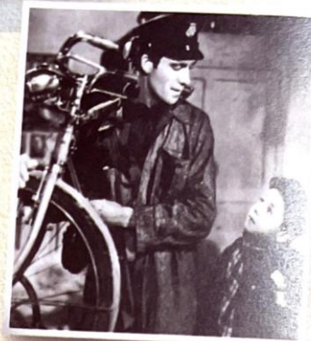
Una scena dal film - simbolo del neorealismo. Ladri di Biciclette

Forse il periodo più glorioso del cinema italiano. Si chiama così perché i registi di quel periodo hanno cercato di dare un'immagine vera della società italiana dopo la seconda guerra mondiale. I film più importanti sono stati Roma città aperta (1944 con Anna Magnani) girato da Roberto Rossellini in una Roma ancora occupata dai nazisti e il bellissimo Ladri di Biciclette (1948) di Vittorio De Sica, con attori presi dalla strada (Oscar per il miglior film straniero).